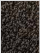
Black Mink DF 675