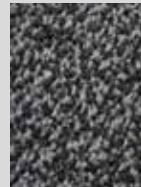
Black Steel DF 681