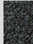
Granite DF 647