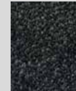
Midnight Grey DF 648