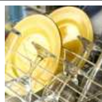
Lavado vajilla máquina