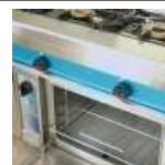
Hornos de convección autolimpiables