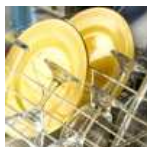
Lavado vajilla máquina